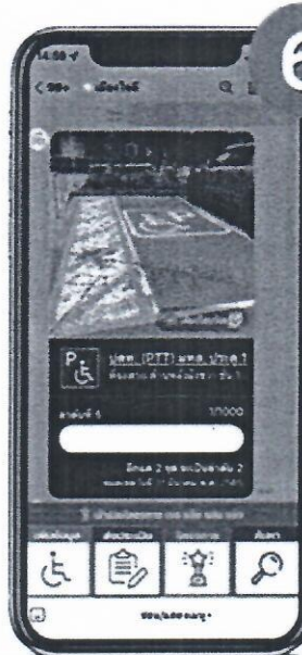
6 รับการ์ดแจ้งขึ้นทะเบียน รับการ์ดยืนยัน สะสมการแจ้ง แลกรางวัล ตามเงื่อนไข

ขอบคุณข้อมูลจาก : https://www.traffy.in.th/?page_id=25496