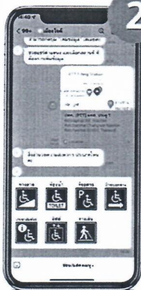
2 กดเลือกประเภทในภาพ กดเลือกสิ่งอำนวยความสะดวก สะดวกในรูปแบบภาพ ได้ง่ายๆ