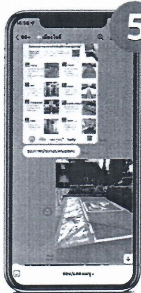
5 ส่งรูปภาพประกอบ เลือกส่งรูปภาพ ที่ชัดเจน สังเกตได้โดยง่าย