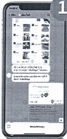
1 แดรต์ตำแหน่ง เพื่อขึ้นทะเบียนสิ่งอำนวยความสะดวก